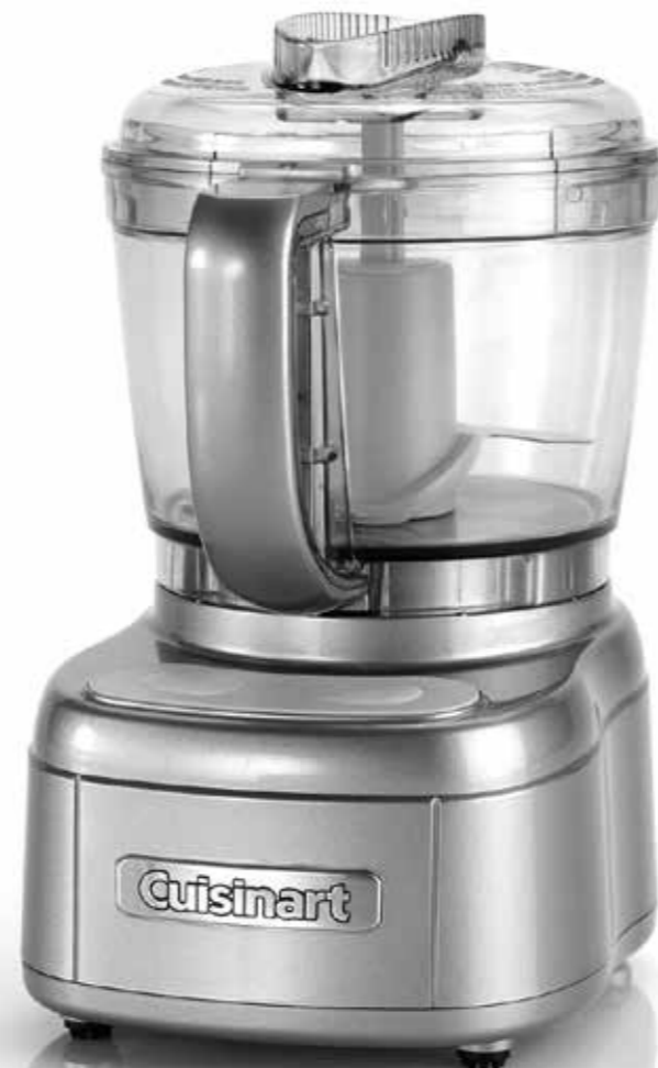
MINI PREP PRO ECH4 Series Q158a